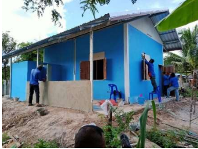
(๑)สร้างบ้านให้ครัวเรือนยากจน โดยงบสภาองค์กรชุมชน และงบเหล่ากาชาดจังหวัดยโสธร