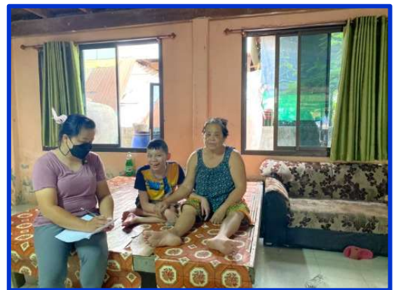
ทีมพี่เลี้ยงให้คำแนะนำในการกินอาหารให้ถูก สุขลักษณะ ตำบลคือเหนือ