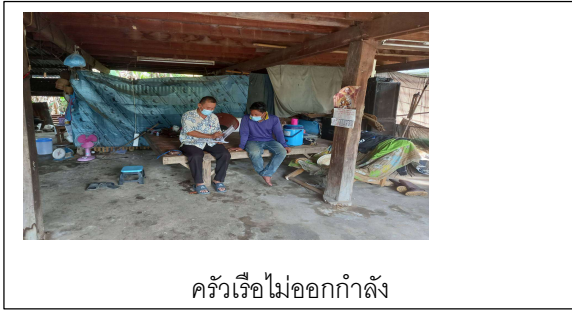
ครัวเรือไม่ออกกำลัง