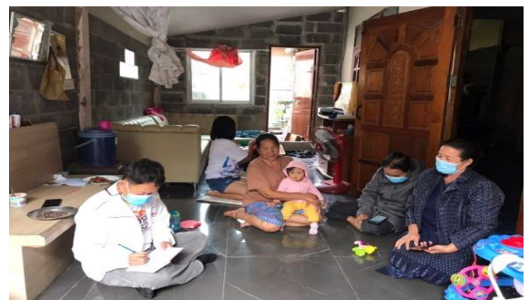
มอบทุนการศึกษาแก่ครัวเรือนเป้าหมาย, ทีมพี่เลี้ยงได้ให้คำแนะนำและส่งต่อเข้าเรียนในระดับต่างๆ ของ กศน.