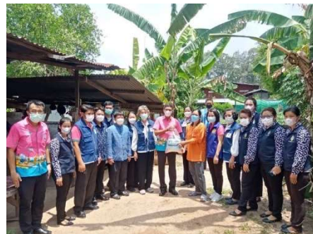
ลงพื้นที่ช่วยเหลือเบื้องต้นโดยการมอบถุงยังชีพให้แกครัวเรือนเป้าหมาย (กรณีสงเคราะห์) และส่งเสริมอาชีพให้แกครัวเรือนเป้าหมาย (กรณีพัฒนาได้) โดยการแนะนำการลดรายจ่ายโดยการปลูกผัก สวนครัวเรือนไว้บริโภคในครัวเรือน, ที่ว่างสร้างอาหาร, การทำบัญชีครัวเรือน ฯลฯ