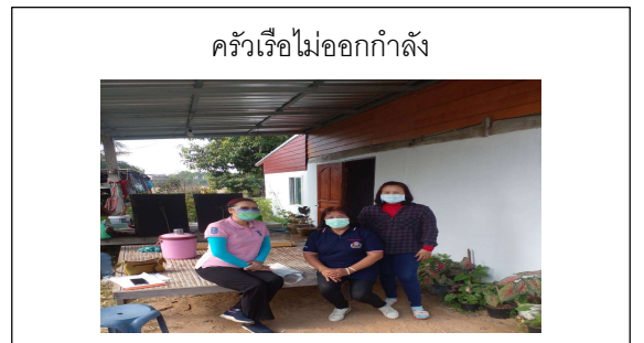
ครัวเรือไม่ออกกำลัง