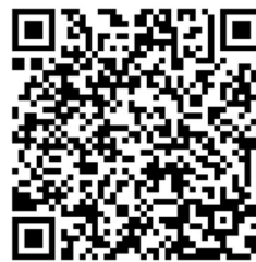
ช่องทางส่งงาน