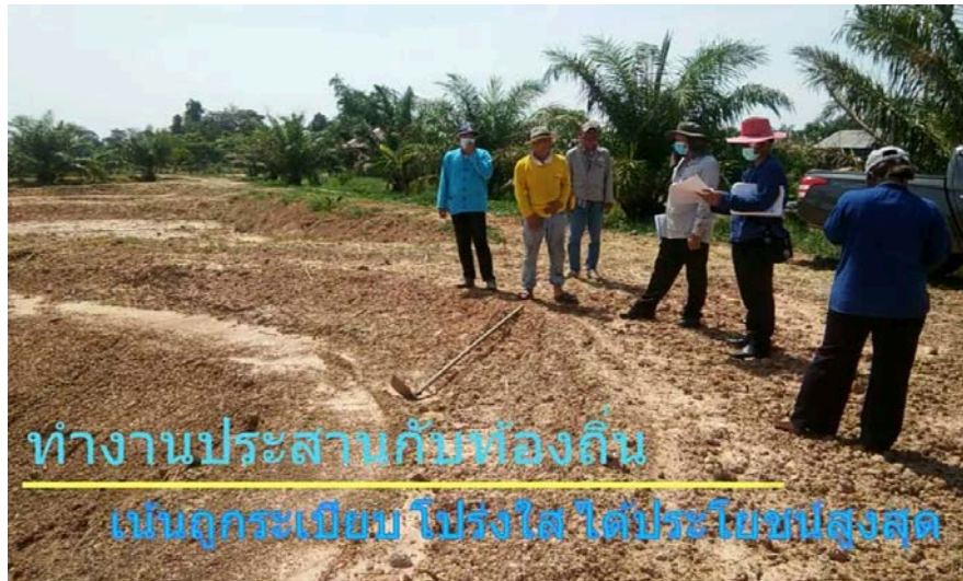
ทำงานประสานกันท้องถิ่น เน้นถูกระเบียบ โปร่งใส ได้ประโยชน์สูงสุด