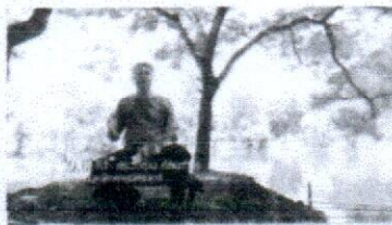
เกษตรทฤษฎีใหม่(8/8) โคก หนอง นา โมเดลเพื่อ การจัดการน้ำอย่างยั่งยืน