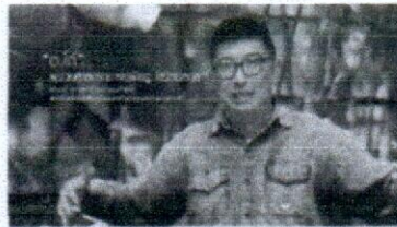
เกษตรทฤษฎีใหม่(2/8) หลักการออกแบบพื้นที่ ด้วยภูมิสังคม