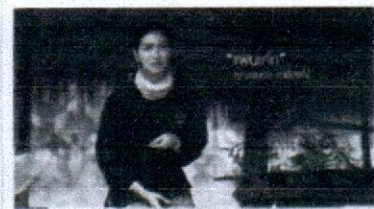
เกษตรทฤษฎีใหม่(7/8) โคก หนอง นา ธารา โมเดล ตอนที่ 2