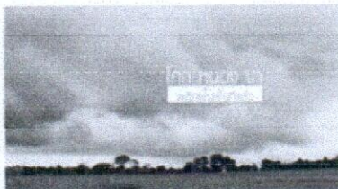
เกษตรทฤษฎีใหม่(5/8) โคก หนอง นา หลักพื้น พื้นที่น้ำจืด ตอนที่ 2