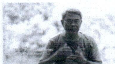
เกษตรทฤษฎีใหม่(1/8) สาธิตพระราชาสู่โคก หนอง นา โมเดล