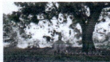
เกษตรทฤษฎีใหม่(4/8) โคก หนอง นา หลักพื้น พื้นที่น้ำจืด ตอนที่ 1