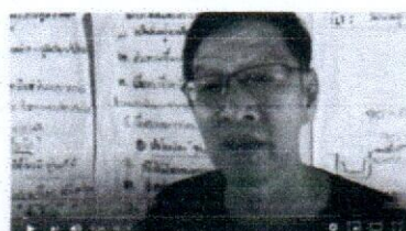
เกษตรทฤษฎีใหม่(6/8) โคก หนอง นา โมเดล และการจัดการน้ำ