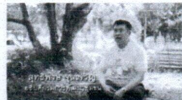
โคก หนอง นา โมเดลเพื่อจัดการน้ำอย่างยั่งยืน และฟื้นฟูป่าชุมชน