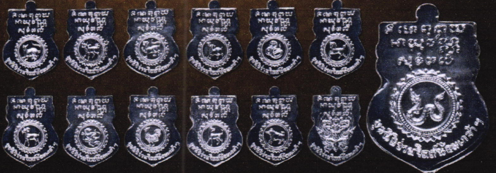
เหรียญเนื้อเงิน บุษบาเหรียญละ: 1,800 บาท