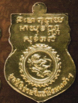
เหรียญเนื้อทองแดงชุกทอง บูชาเหรียญละ 200 บาท