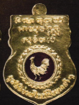
เหรียญเนื้อทองแดงชุกทองลงยา บูชาเหรียญละ 350 บาท