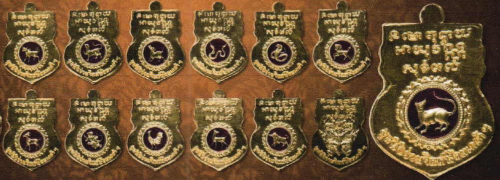
เหรียญเนื้อทองคำลงยา บุษบาเหรียญละ: 48,000 บาท