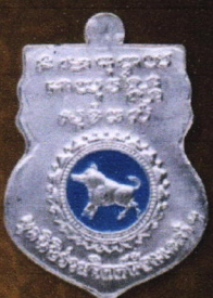
เหรียญเนื้อเงินลงยา บูชาเหรียญละ 2,000 บาท