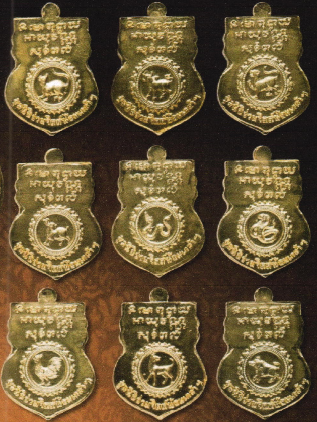
เหรียญเนื้อทองคำ บุษบาเหรียญละ: 46,000 บาท