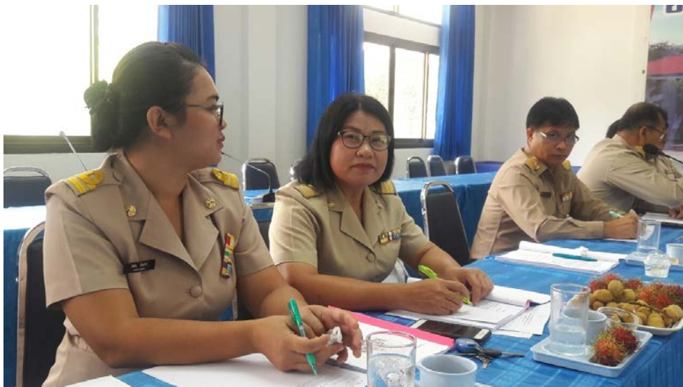
รูปภาพการประชุม พอ. สัจจร ครั้งที่ 6/2562 ณ สพอ.ค้อวัง