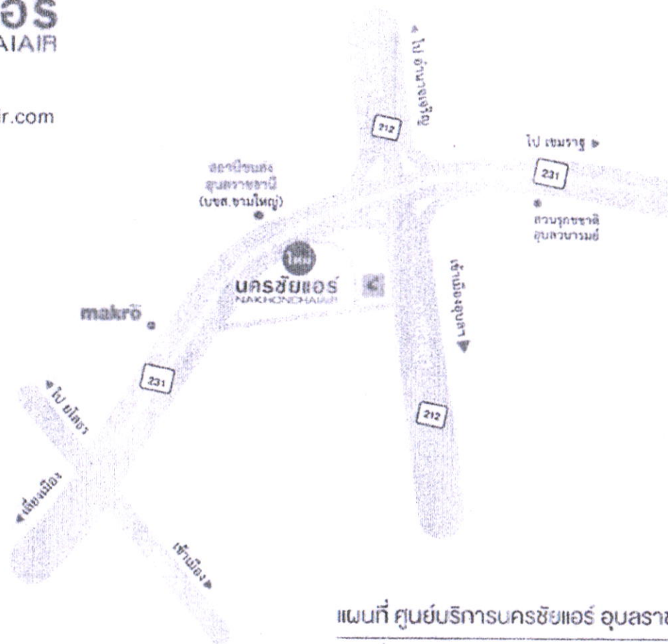
แผนที่ ศูนย์บริการนครชัยแอร์ อุบลราชธานี (แห่งใหม่)